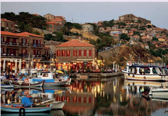
Insel Lesbos: Blick vom Hafen auf die Burg und Stadt Mithymna

So kam ich 2001 mit einer ersten Gruppe von Menschen für eine Woche auf die Insel – mit dem Seminar: „Mich selbst und das Leben lieben lernen“, das bis heute eines der wichtigsten Seminare hier geblieben ist. Ich spürte von Anfang an, dass hier etwas anders war, nachdem ich schon einige griechische Inseln kennengelernt hatte. Es waren aber nicht die Schönheit der so grünen Landschaft, die idyllischen